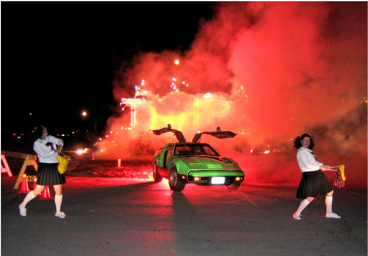
Manifestation au Centre culturel de Caraquet, mai 2007

Cette exposition consiste en une documentation des projets du Collectif, couvrant la période de 2000 à 2008, et aura lieu à la Galerie d'art Louise et Reuben-Cohen de l'Université de Moncton.